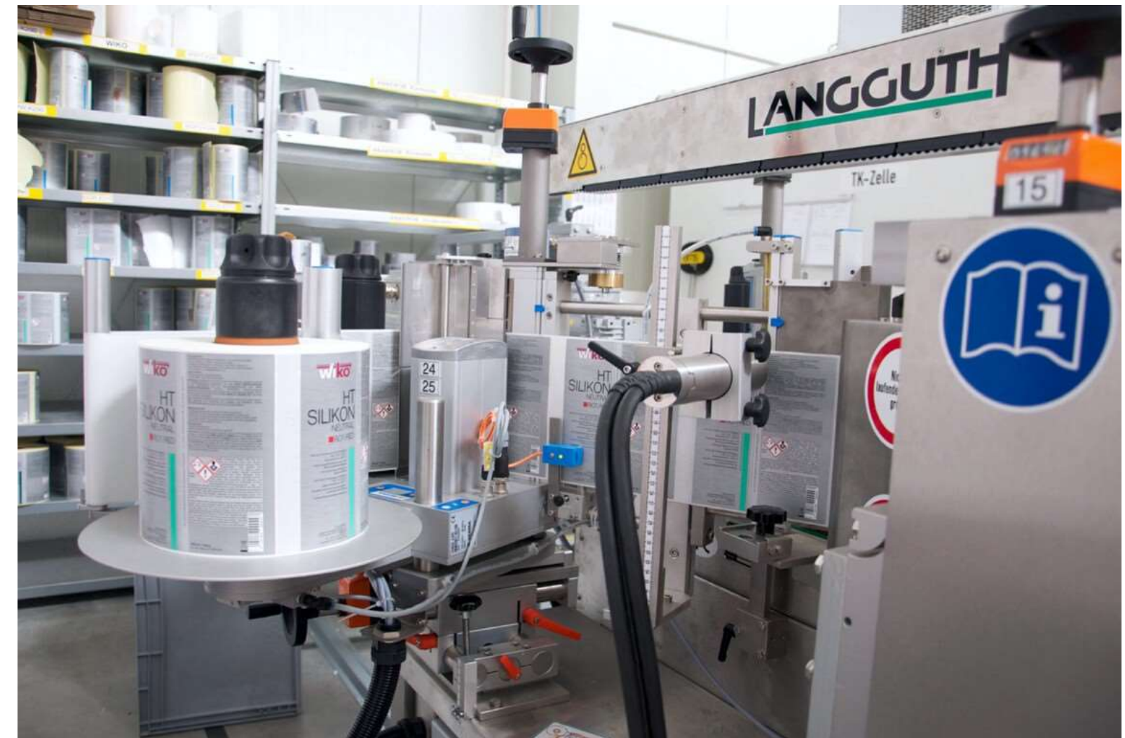
AUTOMATISIERTE UND MANUELLE ETIKETTIERUNG