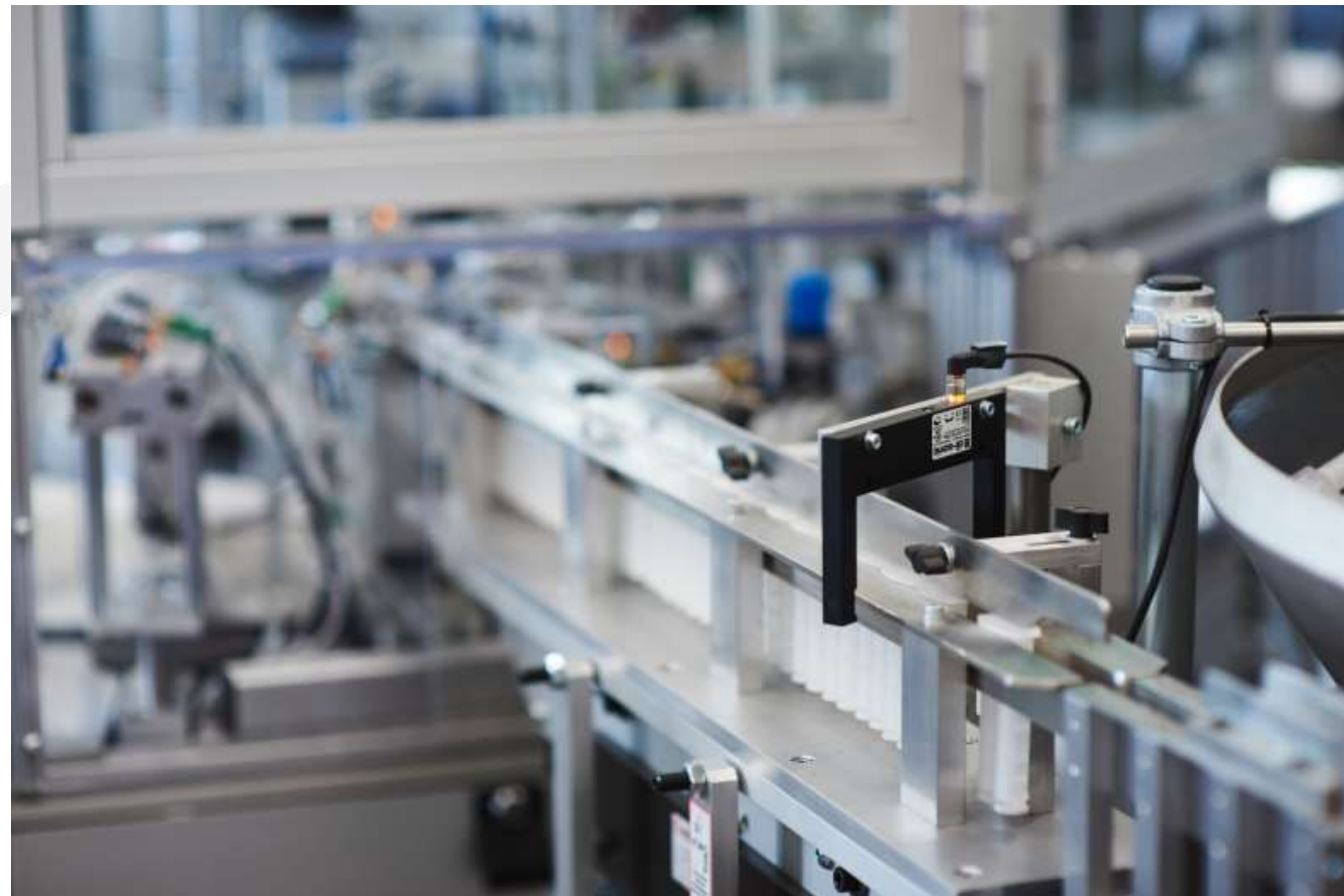
2K VOLLAUTOMAT - 1K VOLLAUTOMAT - 2K HALBAUTOMAT