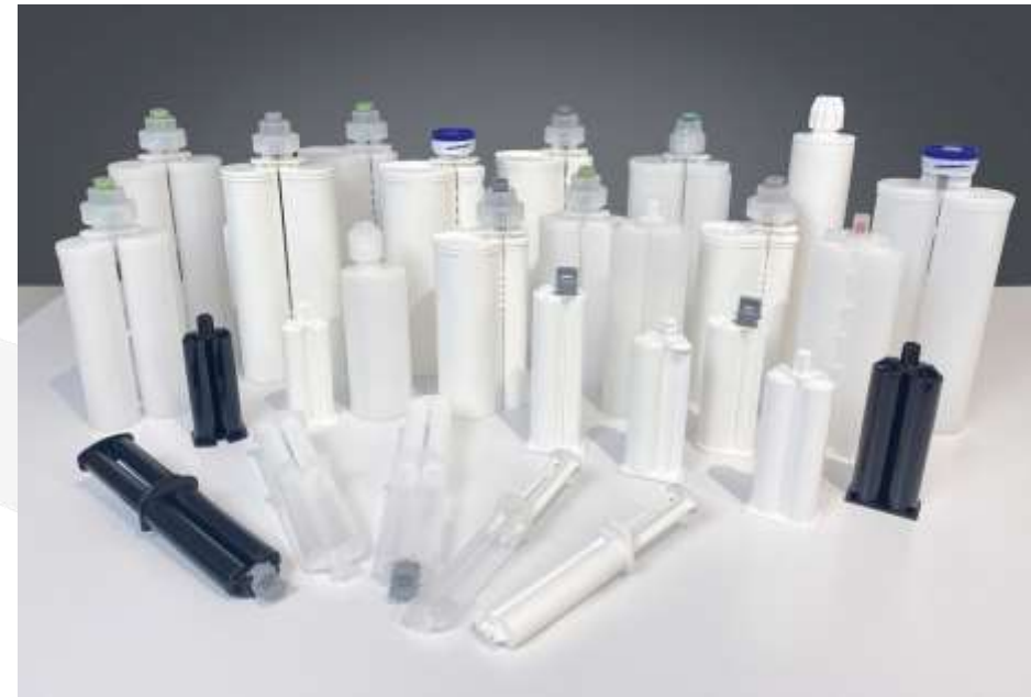
2K & 1K KARTUSCHEN UND SPRITZEN